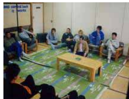
藤岡のミーティング風景

このテーマの不適格者がそれを書いてしまっているという居心地の悪さを拭いきれず、こんな文章になってしまったことを心からお詫びします。