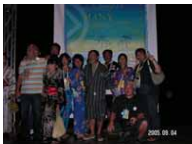
日本から参加した女性は浴衣でした