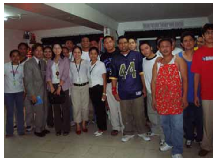
コクーン・ファウンデーションの仲間たち